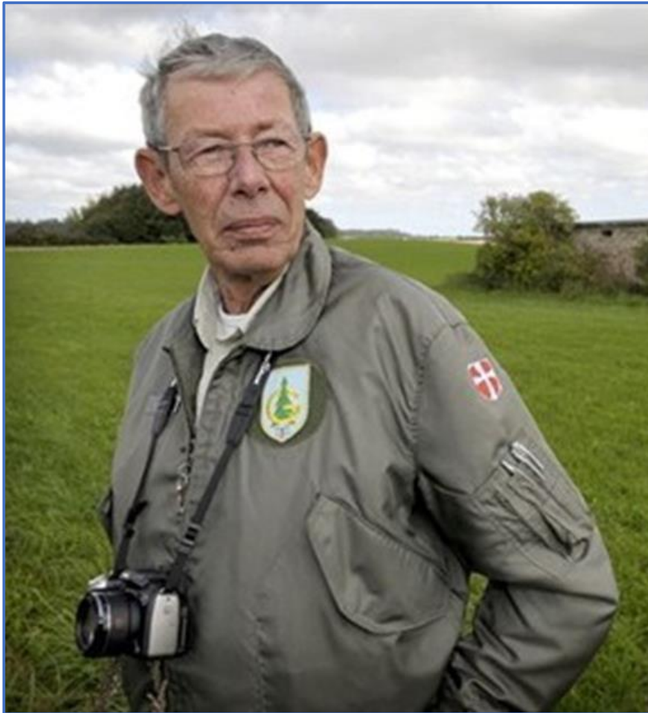
SES under feltarbejde med lokalisering af bygninger og fundamenter tilknyttet Luftwaffes jagerluftforsvar i Danmark under besættelsen. Billedet er fra 2010.