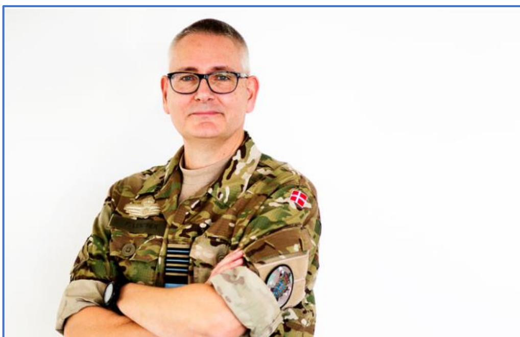
General Flemming Lentfer overtog jobbet som forsvarschef 1. december 2020