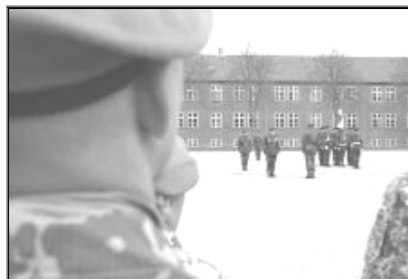
Sidste gang Danmark havde en større FN-styrke i udlandet var i Sudan i 2005.

Foreningen De blå baretter markerer senere på måneden de 50 år med et jubilarstævne på Antvorskov kaserne. Foreningen selv er oprettet i 1968 og spiller, trods nutidens mange NATO-missioner, stadig en rolle for udsendte danske soldater.