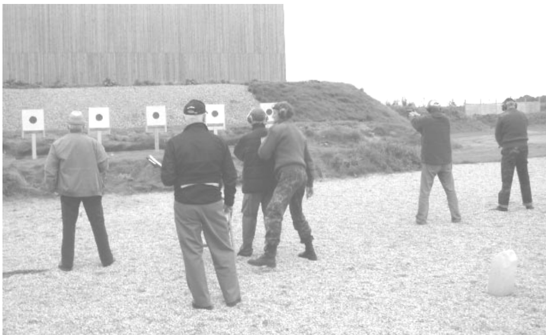
Der skydes og efterses ved Holbæk Fjord – Dengang var det endnu lyst.