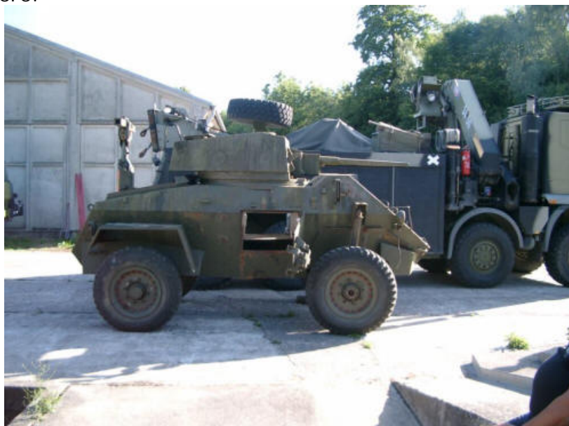
Den gode gamle HUMBER – slibe- og maleklar

Vi arbejder stadig intensivt sammen med Statens Forsvarshistoriske Museum (Tøjhusmuseet), Hærens Kampskole, Jyske Dragonregiment, DMKF, Gilleleje Gruppen samt en hel del andre om at få skabt et aktivt og spændende museum for hæren – med afdelinger over hele landet. Arbejdsgruppen samles straks i det nye år – så vi kan komme videre.