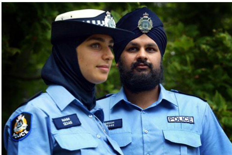
Her er et andet eksempel - fra Australisk politi.

»Det militære personels uniform sikrer blandt andet ensartethed, så det er muligt at genkende medlemmer af de væbnede styrker og skelne dem fra civilbefolkningen. Uniformen er desuden udviklet sådan, at den yder den enkelte soldat størst mulig sikkerhed. Derfor er det på dette område ikke muligt at udvise samme fleksibilitet overfor medarbejdere, der er ansat eller gør tjeneste i militære funktioner, som det er over for deres civile kollegaer«, siger ministeren.