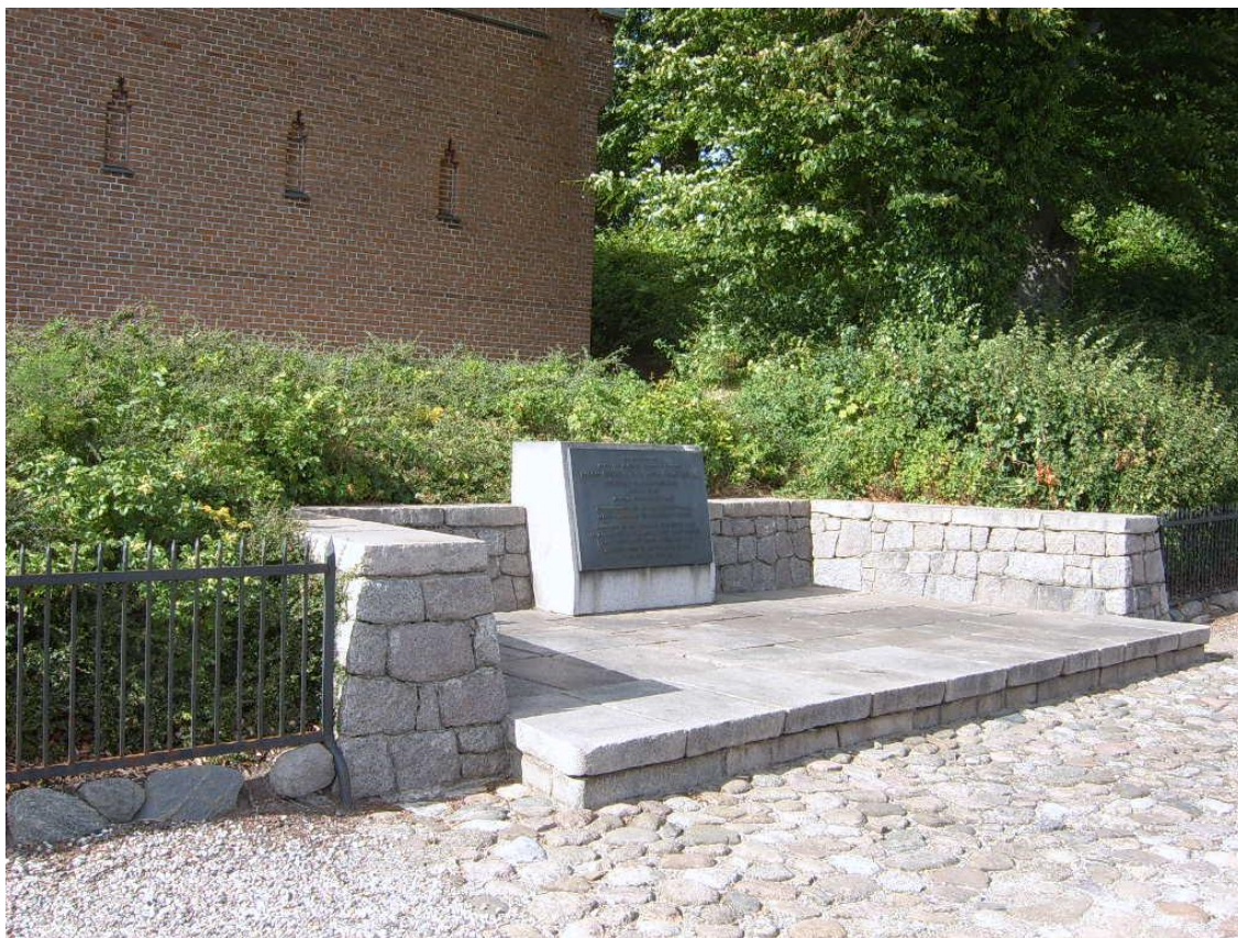
Mindelund for Major Anders Lassen ved Sankt Peders Kapel ved Præstø Fjord nær Tappernøje i Sydsjælland.

Kaptajn Lassen var på det tidspunkt en meget respekteret soldat i elitekorpserne og den britiske hær. Udover at være en populær officer var han i besiddelse af et stort moralsk mod, originalitet, humor og stille medfølelse for sine medmennesker.