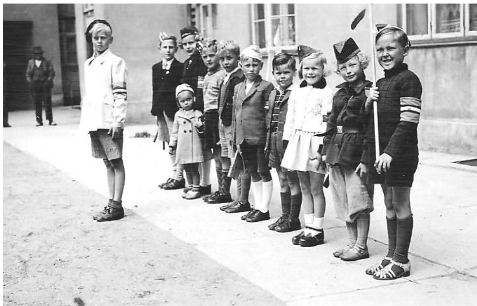
Redaktøren som fanebærer på venstre fløj - opstillet til sejrsparede med mine legekammerater sommeren 1945.