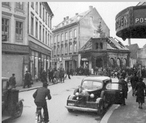
Billedet viser Hovedvej 1 gennem Slagelses bymidte, som den så ud under besættelsen. Bemærk den udbombede forretning i baggrunden.