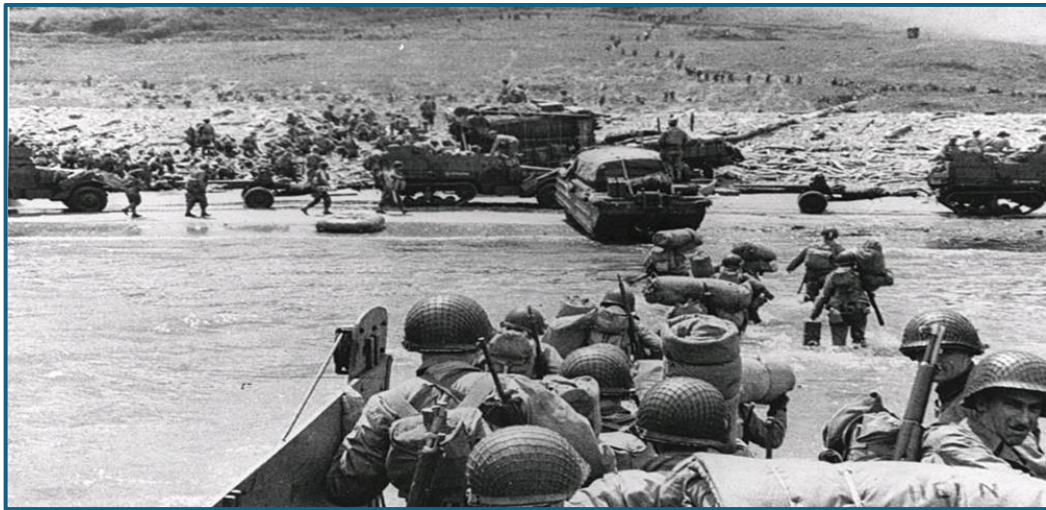
Fra invasionen i Normandiet

belyser blandt andet nye historier, som man ikke har hørt så meget om før. Det er altså ikke udelukkende den gængse fortælling om invasionen i Normandiet, som man ofte hører, men i høj grad med fokus på de danskere, der deltog.