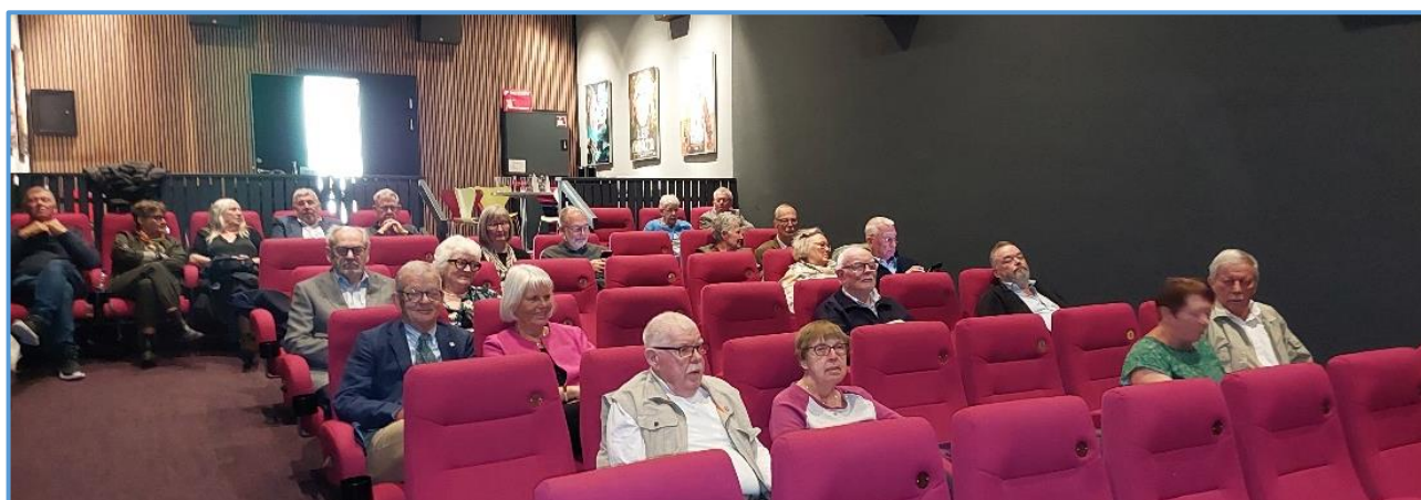
Klar til "One Life"

Herefter satte vi alle os – bevæbnet med vin, øl eller vand - i biografsalens behagelige stole og så filmen "One Life" med Anthony Hopkins i den bærende hovedrolle.