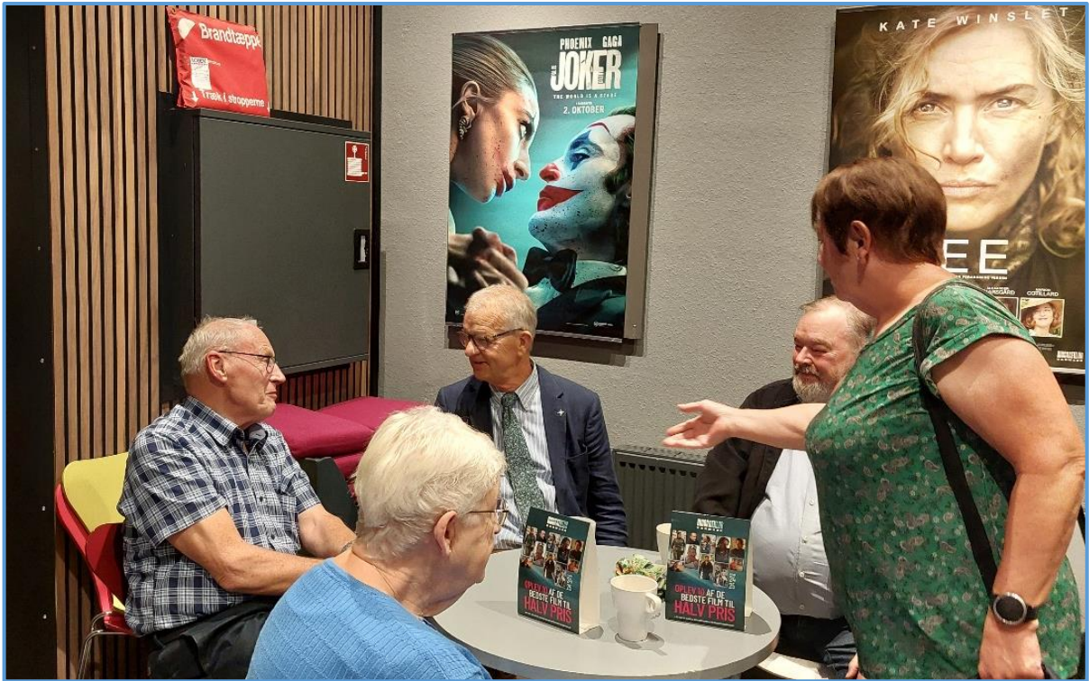
Hyggesnak efter filmen