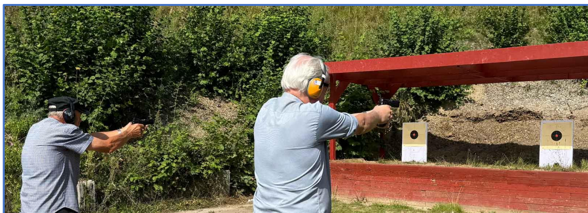
Præcisionskydning med 9mm pistol på 10 m afstand, Hanebjerg Skyttecenter