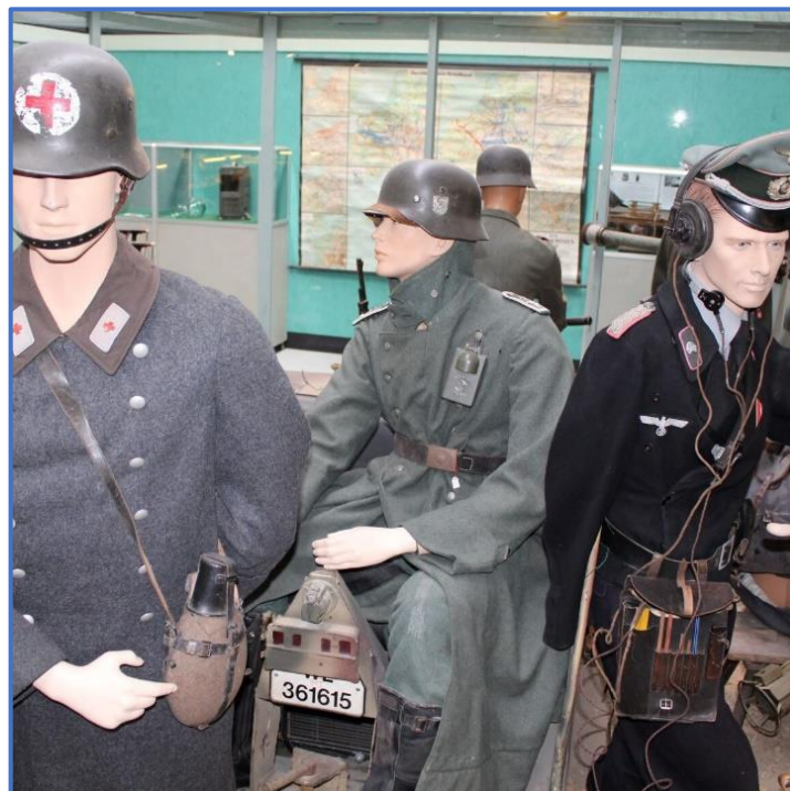
Livet i en tysk bunker