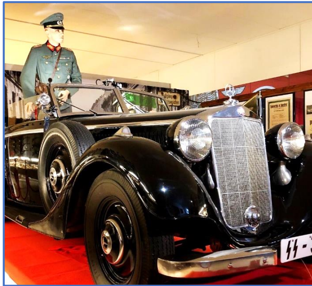
Reynhard Heydrich (voksfigur) poserer i sin Mercedes i Prag 1942.

sprængattentat i Prag i 1942 udført af tjekkiske modstandsfolk. Bomben ramte højre baghjul, og splinter trængte gennem bilsædet og dræbte Heydrich. Nu står bilen her som et museumspragtstykke: