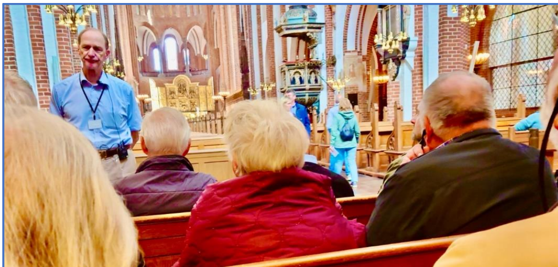
Vores guide beretter om Roskilde Domkirkes spændende historie

Vi fik også navne og årstal på de honnerte mænd og kvinder, som er gravlagt under de mange lig-sten i midtergangen.