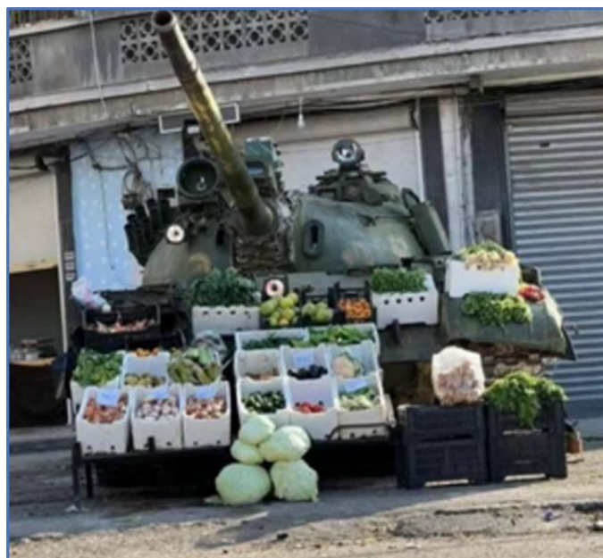
Billedeksempler fra Facebook