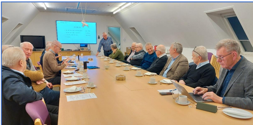
Fra gGeneralforsamlingen 2025

Efter GF blev der serveret smørrebrød med tilhørende øl/vand og snaps.